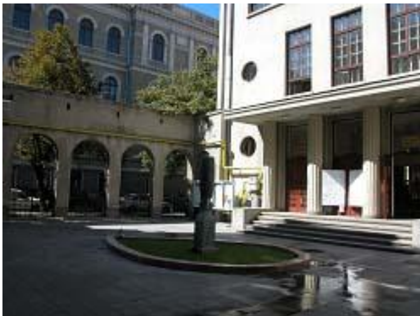
Facultatea de Studii Europene a Universității Babeș Bolyai din Cluj-Napoca

✚ Restaurant Piramida (în curtea Facultății de Studii Europene)